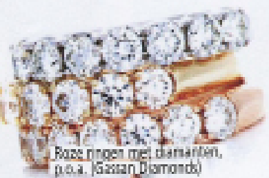
Roze ringen met diamanten, p.p.a. (Gaston Diamonds)