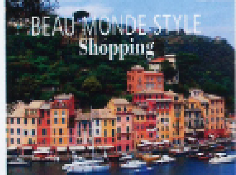
BEAU MONDE STYLE Shopping