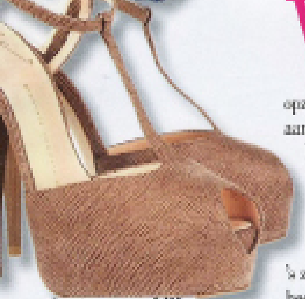
Peeptoes pumps, €425,- (Giuseppe Zanotti)