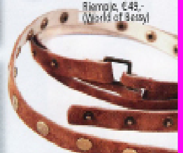
Riemje, €48,- (World of Bessy)

SLAPEN www.olornapoverphoto.com DINEREN www.cipriani.com UITGAAN www.billionaireclub.com