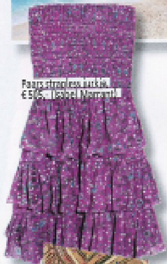
Paars strapless jurkje, €50,- (Isabel Marant)