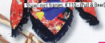
Shawl met franje, €110,- (Paul & Bear)