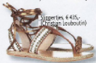
Sandals, €435,- (Kristian Louboutin)

einde middag. Ik fris me op en ga, gekleed in mijn paillettenrokje van Haute Hippie, met een zijden topje en mijn nude peeptoes van Giuseppe Zanotti, met mijn vrienden dineren bij de Country Club. De tafels staan om een verlicht zwembad. De entourage én de gasten zijn op en top. Na het eten is het tijd om richting de dansvloer te gaan, want naast het restaurant bevindt zich de club van Country Club. Iedereen gaat los, wat is dit een topavond! De volgende morgen schiet ik in mijn bikini om eventjes