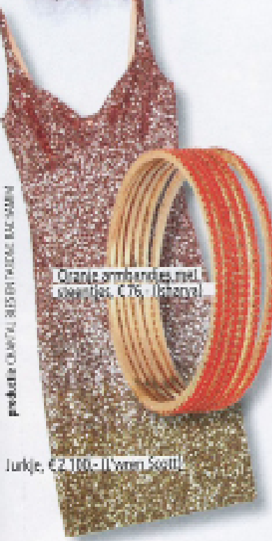
Oranje armbandjes met kwarts, €76,- (Koray)